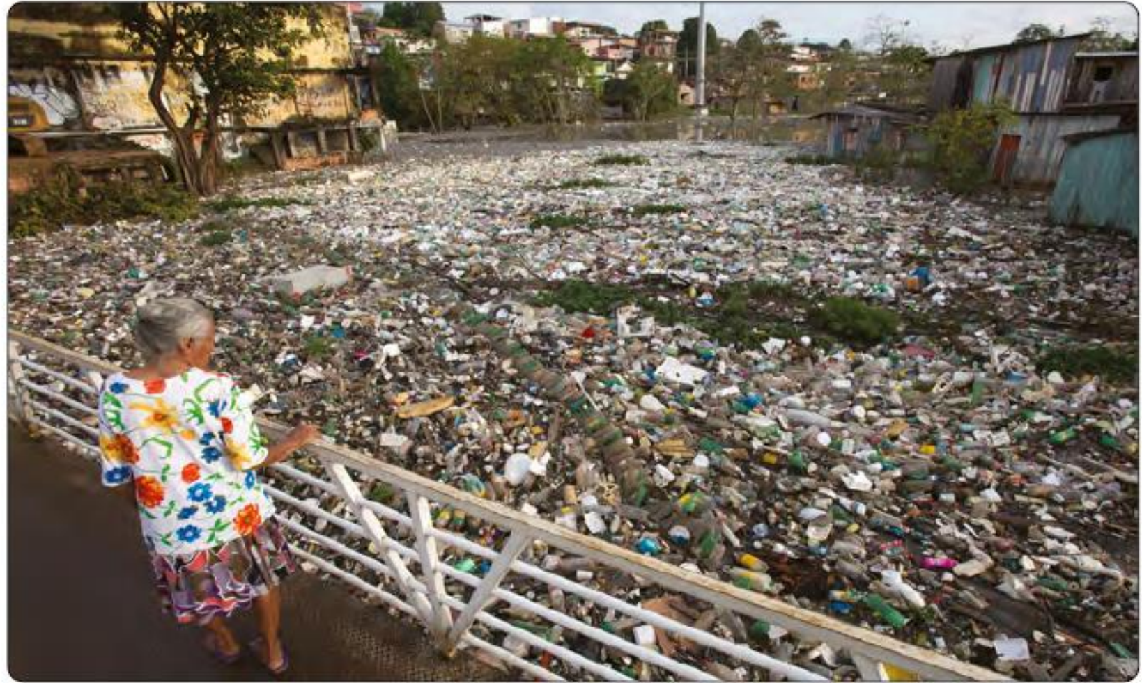
Figure 1. Dense carpet of garbage floating in one of the poorest regions of the city of Manaus (Middle Amazon basin, Brazil).

Brazilian government policies to promote economic growth in Amazonia triggered an increase in the region's population, from 1.4 million to 15.9 million inhabitants in less than a century (IBGE 2018). These people are distributed across more than 450 municipalities, 70% of which lack urban planning and